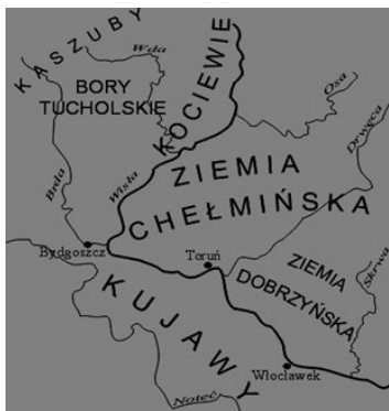
Rys.: Krainy historyczne.

Obszar „Stowarzyszenia Lokalna Grupa Działania Gmin Dobrzyńskich Region Północ” znajduje się na terenie regionu historyczno-geograficznego Ziemi Dobrzyńskiej, we wschodniej części województwa Kujawsko-Pomorskiego. Ze względu na lokalizację posiada on pewne specyficzne uwarunkowania, m.in. w postaci licznych zasobów historyczno-kulturowych, predysponujących go do rozwoju szeroko rozumianej turystyki. Powiat rypiński należy do najstarszych jednostek samorządowych w kraju. Pierwsze wzmianki o powiecie pochodzą już z XIV w., natomiast Kasztelania Rypińska datowana jest od XI w. Prawa miejskie Rypin otrzymał w roku 1345. Wydarzenia historyczne, mające miejsce na tym obszarze ukształtowały jednocześnie tożsamość i odrębność kulturową tego terenu oraz zamieszkujących go ludzi, czego przejawem są m.in. strój dobrzyński i liczne lokalne zespoły pieśni i tańca.